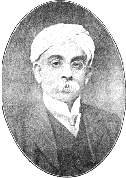
नारायण गणेश चंदावरकर